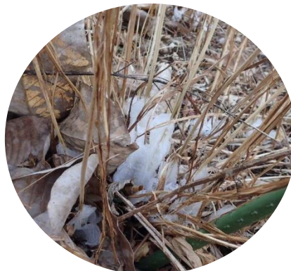
シモバシラ(シソ科)