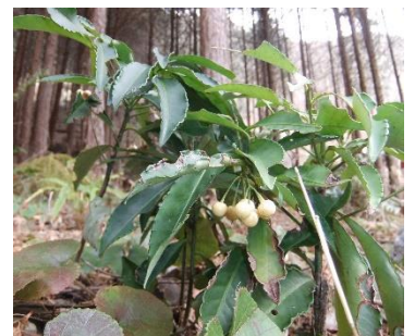
白実のマンリョウ (サクラソウ科)