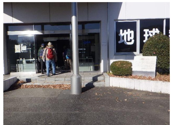
地球観測センターJAXA