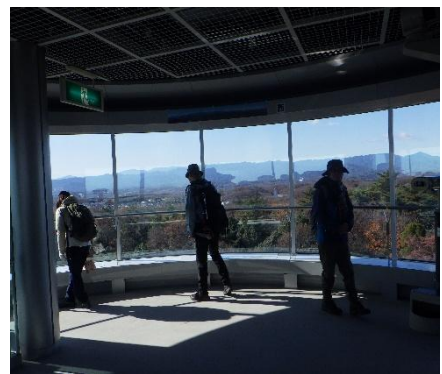
ピースミュージアムの展望台