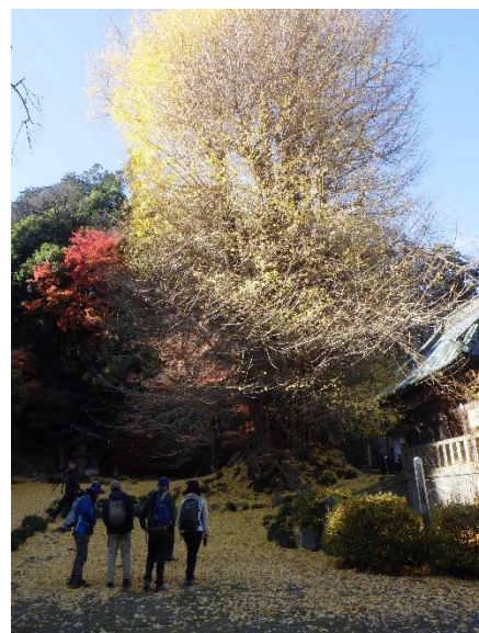
正法寺の大モミジ