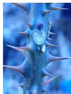
カラスザンショウ