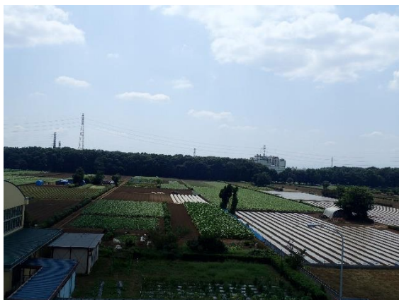
(上富小学校の屋上から)

午後は上富小学校の屋上にのぼらせていただき地域を見渡し、地割の確認をしました。その後、早川農園にうかがい、実際に畑と雑木林をみせていただきました。上からみる以上の広大さにあらためて驚きました。