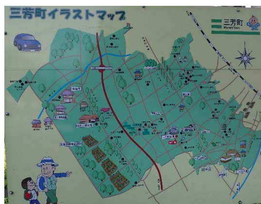
(三芳町のイラストマップ)