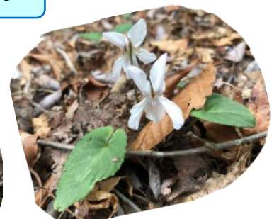
シロバナナガバノスミレサイシン