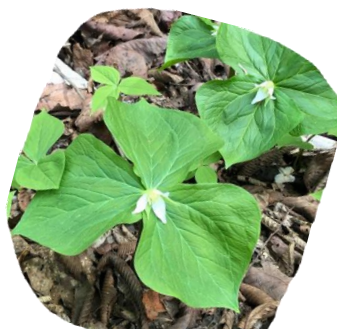
シロバナエンレイソウ